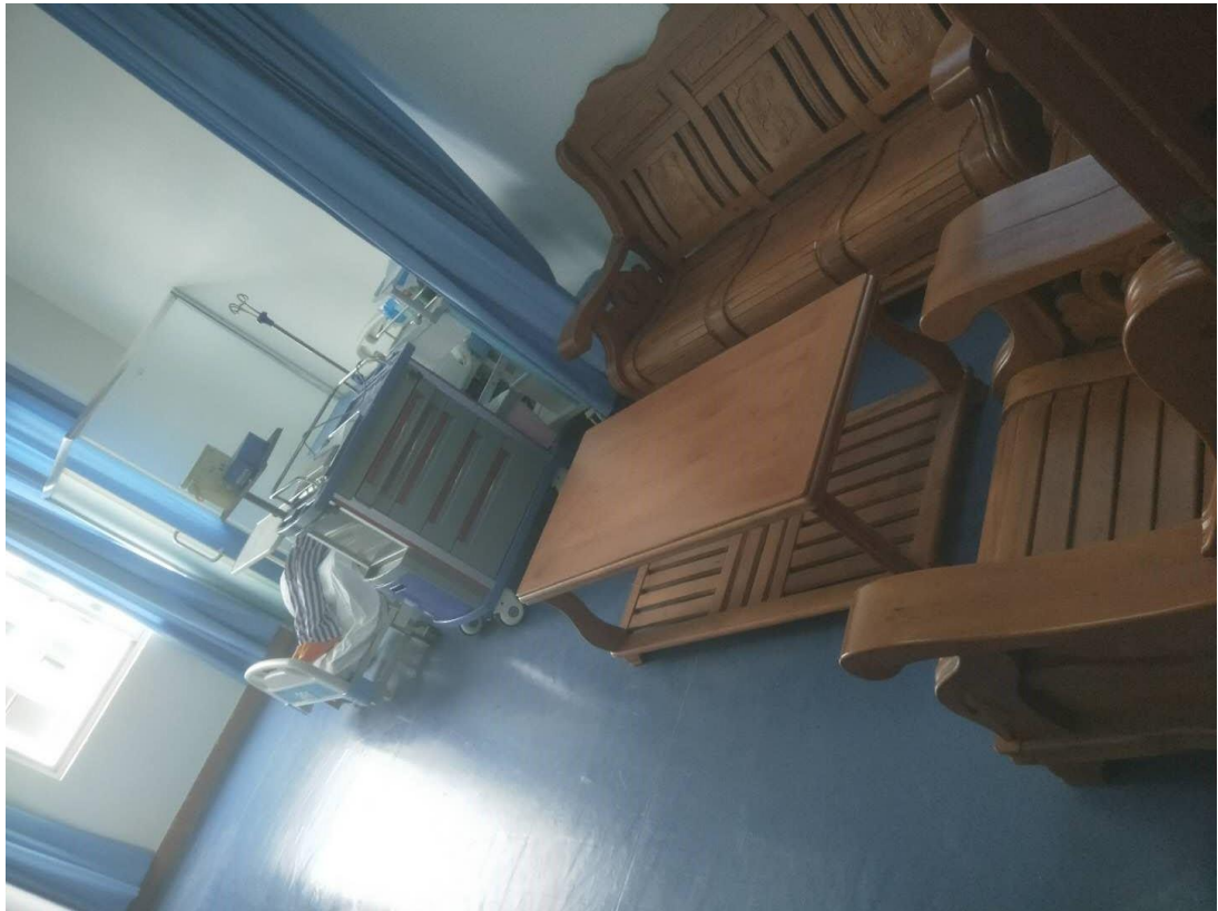
图 3 老年居家环境