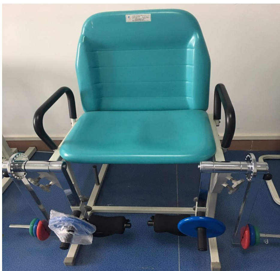
图 13 康复护理实训室——实训设备