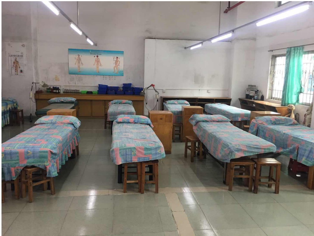
图 13 中医护理实训室——实训床