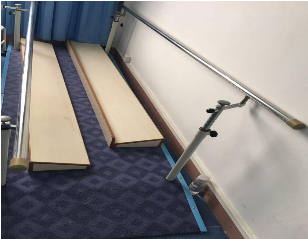
图 10 康复护理实训室——步行康复