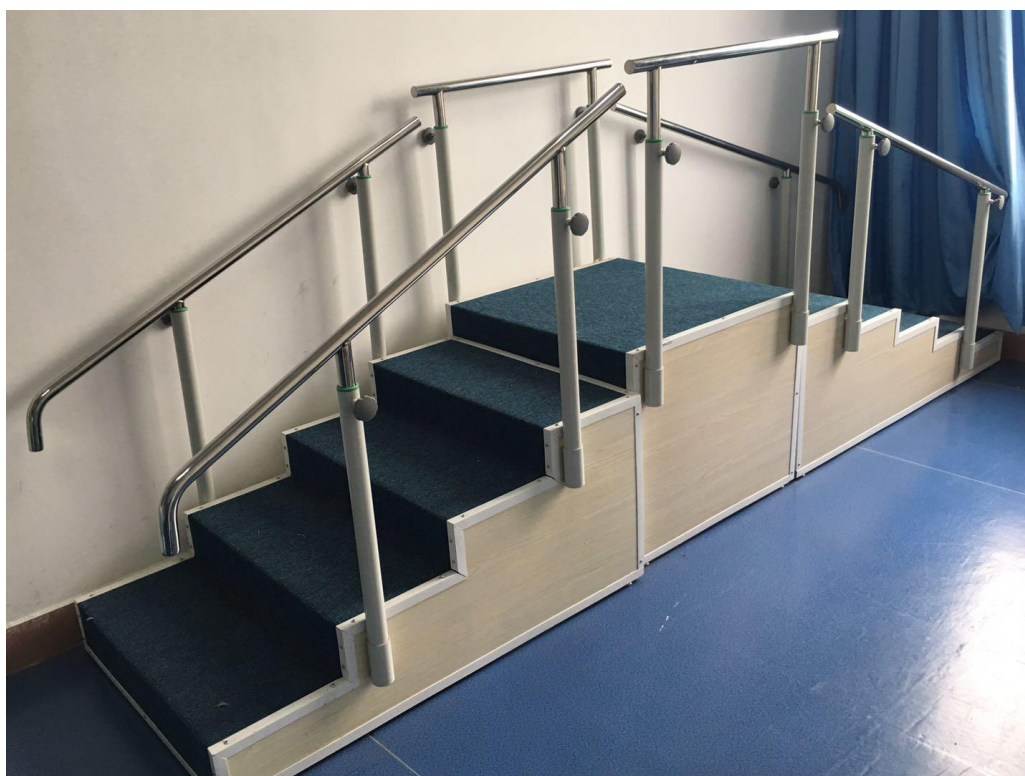
图 9 康复护理实训室——步行康复