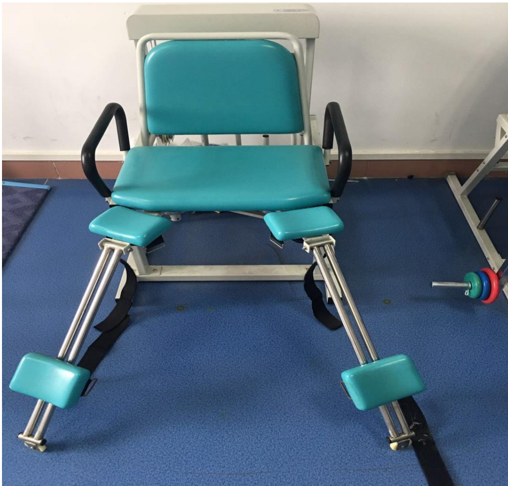
图 11 康复护理实训室——实训设备