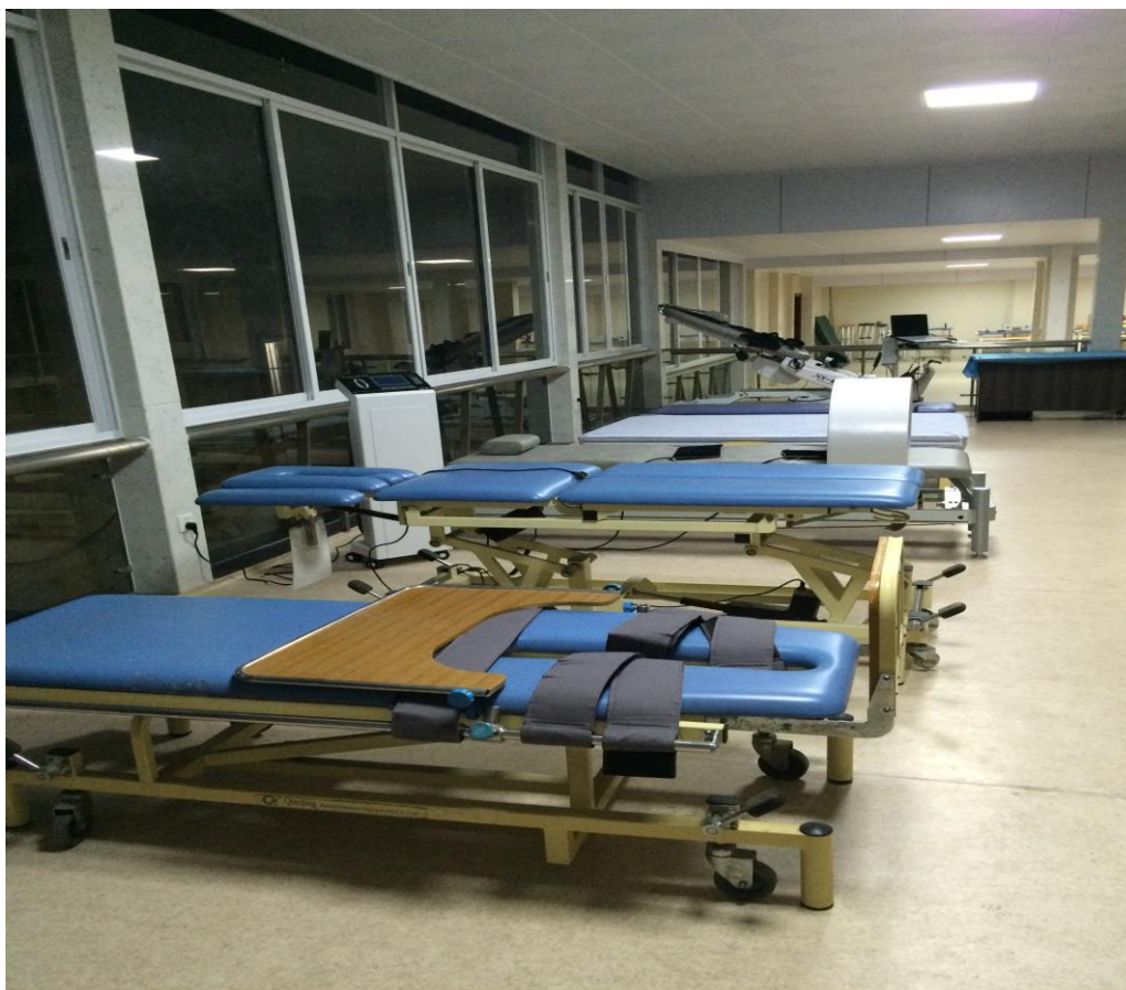
图 8 康复护理实训室——运动治疗室