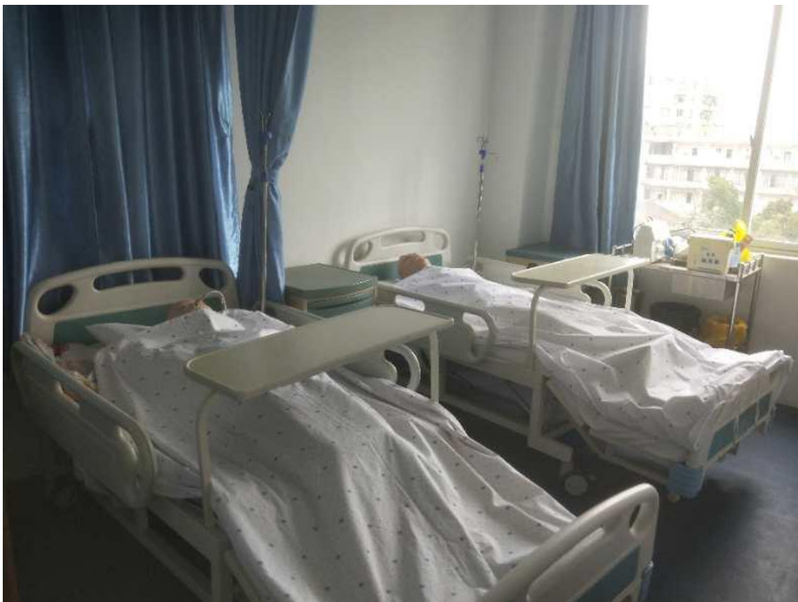
图 1 老年护理实训室——老年病房

学校领导对养老照护实训基地的建设高度重视，对基地建设的规划和实施进行了研究，明确目标，责任到人，分工合作。为加强仪器设备的维护维修工作，提高仪器设备的完好率和利用率，保证教学、科研和行政管理等工作的顺利开展，充分发挥仪器设备的使用效益。学校根据教育部《高等学校仪器设备管理办法》（教高〔2000〕9号文件）、《事业单位国有资产管理办法》（财政部令36号）及《高等学校实验室工作规程》的有关规定，结合学校实际情况，制定了《仪器设备维修管理暂行办法》（详见佐证材料），其中第六章《维修经费管理》第二十二规定：学校每年底核定一次仪器设备维修立项金额，并拨入各维修专项经费。仪器设备维修经费由学校财务处统一管理，专项立账，专款专用。第二十三条规定：校内实训室仪器设备维修费在实验经费中列支。