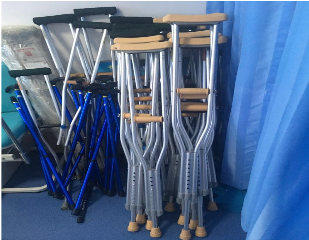
图 6 老年护理实训设备