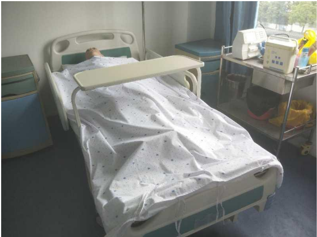
图 2 老年护理实训室——老年重症病房