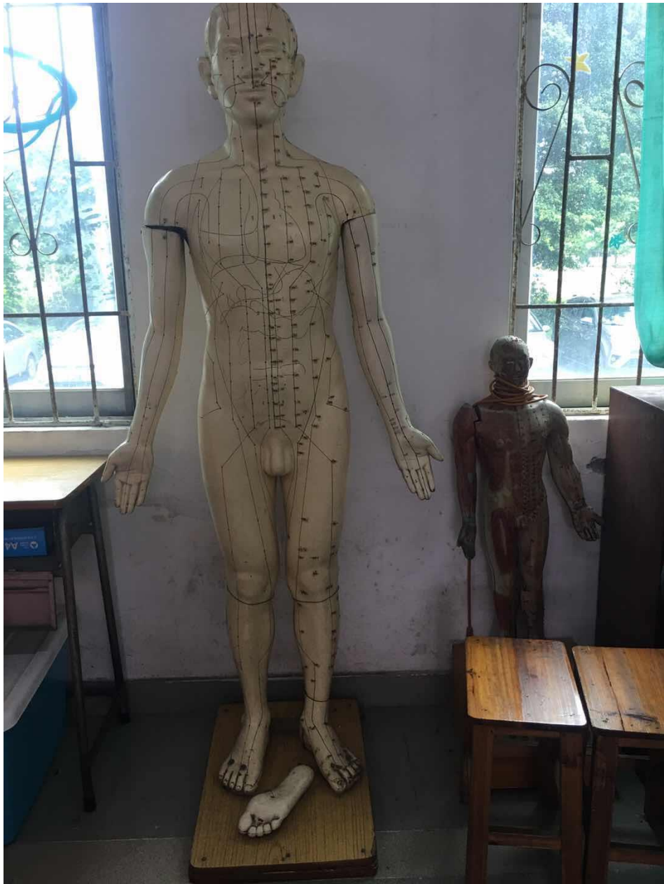
图 15 中医护理实训室——实训设备