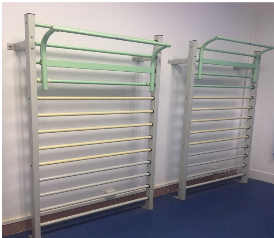
图 12 康复护理实训室——实训设备