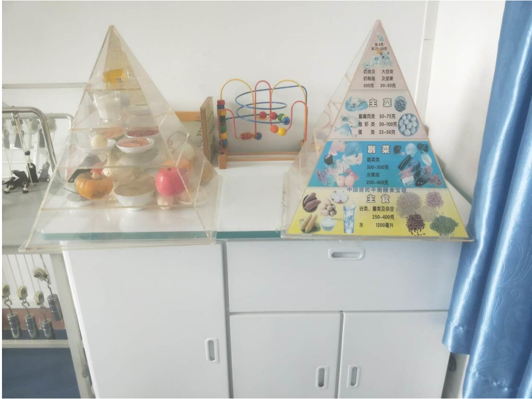
图 4 老年护理实训设备