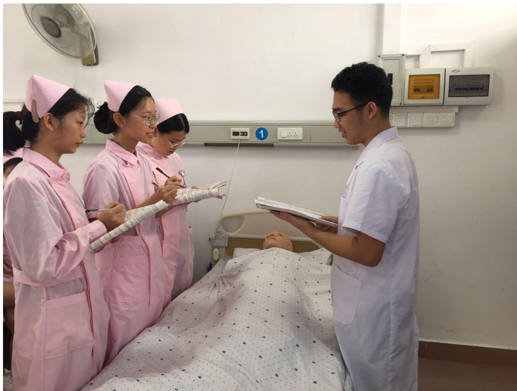
图 7 老年护理实训课堂